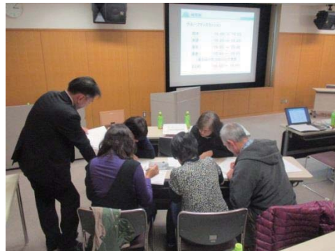
※グループディスカッション