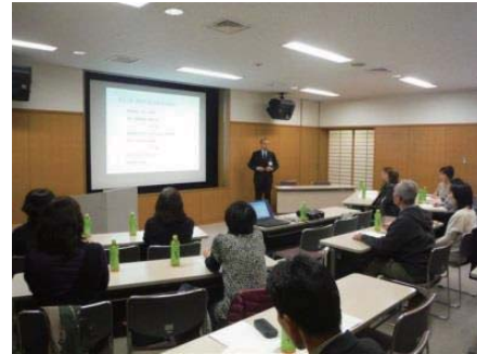
※研修会の様子（北陸）

より多くのスタッフが受講できるよう、9日（水）に本社、16日（水）に北陸、25日（金）に関東、30日（水）に静岡、と今年もエリア別に開催しました。